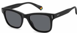
807(M9) ¥10,000 (税込 ¥11,000)