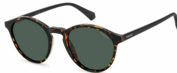
O86(UC) ¥10,000 (税込 ¥11,000)