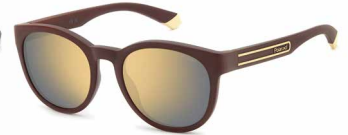
B3V(LM) ¥11,000 (税込 ¥12,100)