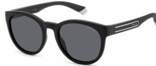
O8A(M9) ¥10,000 (税込 ¥11,000)