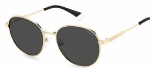
2F7(M9) ¥12,000 (税込 ¥13,200)