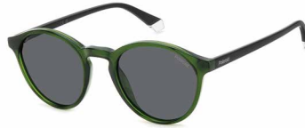
1ED(M9) ¥10,000 (税込 ¥11,000)