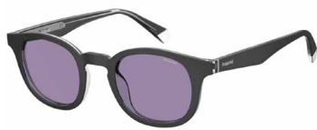
HK8(KL) ¥15,000 (税込 ¥16,500)