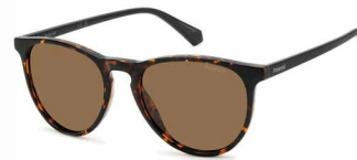
086(SP) ¥10,000 (税込 ¥11,000)