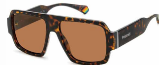
O86(HE) ¥12,000 (税込 ¥13,200)