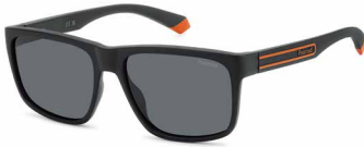
8LZ(M9) ¥10,000 (税込 ¥11,000)