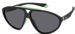
30L(M9) ¥11,000 (税込 ¥12,100)