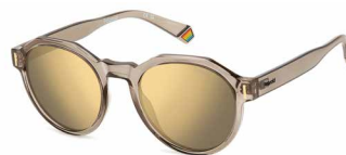
10A(LM) ¥11,000 (税込 ¥12,100)