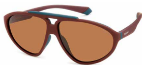
7BL(HE) ¥11,000 (税込 ¥12,100)