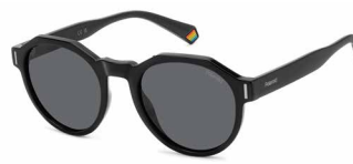
807(M9) ¥10,000 (税込 ¥11,000)