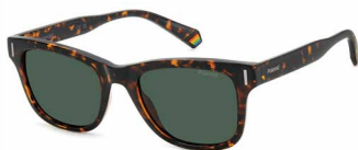
086(UC) ¥10,000 (税込 ¥11,000)