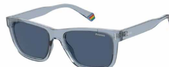
MVU (C3) ¥9,000 (税込 ¥9,900)