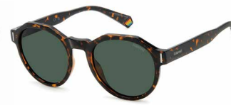
086(UC) ¥10,000 (税込 ¥11,000)