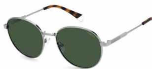
6LB(UC) ¥12,000 (税込 ¥13,200)