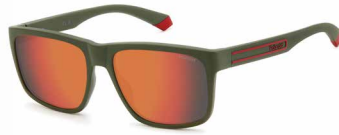
TBO(OZ) ¥11,000 (税込 ¥12,100)