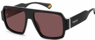
807(KL) ¥12,000 (税込 ¥13,200)