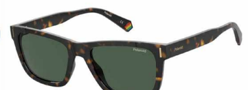
O86 (UC) ¥9,000 (税込 ¥9,900)