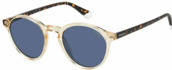
40G(C3) ¥10,000 (税込 ¥11,000)