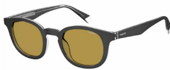
OTL(MU) ¥15,000 (税込 ¥16,500)