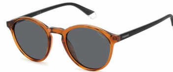
O9Q(M9) ¥10,000 (税込 ¥11,000)