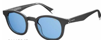
OY4(C3) ¥15,000 (税込 ¥16,500)