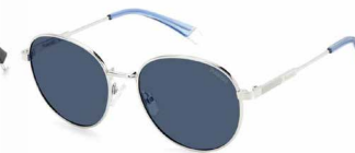
010(C3) ¥12,000 (税込 ¥13,200)