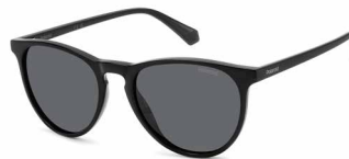
807(M9) ¥10,000 (税込 ¥11,000)